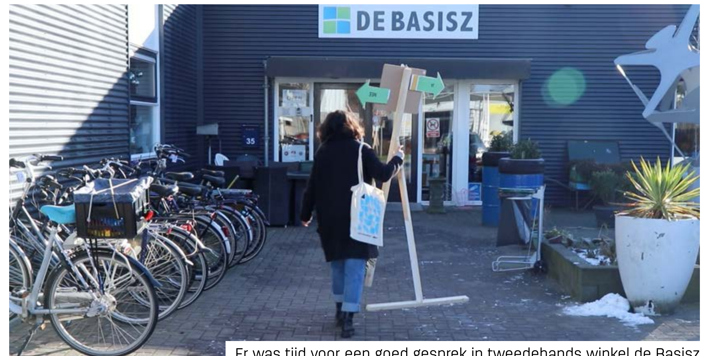
Er was tijd voor een goed gesprek in tweedehands winkel de Basisz