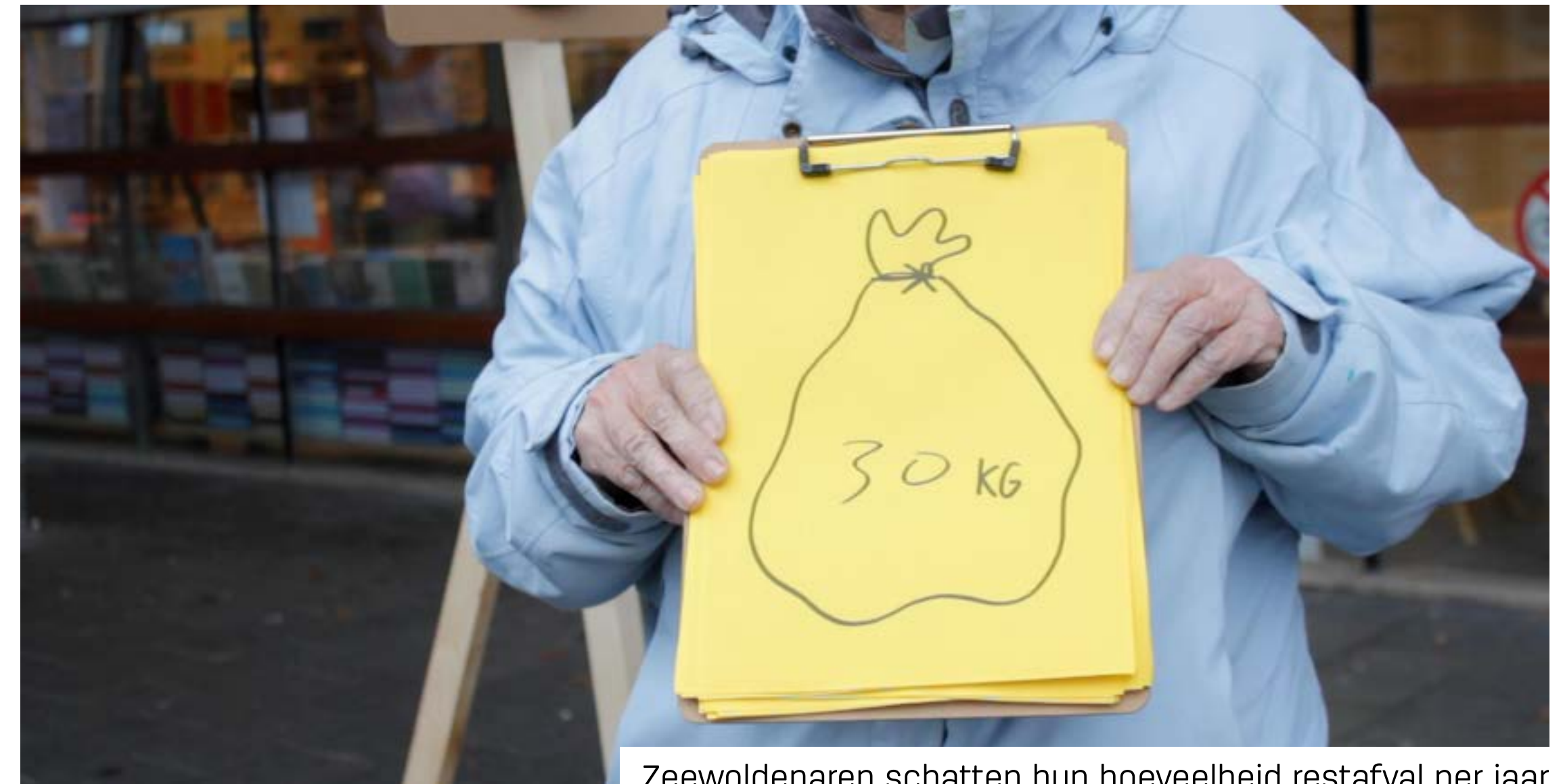
Zeewoldenaren schatten hun hoeveelheid restafval per jaar

“Gezamenlijk en persoonlijk belonen, dat zou kunnen werken.” - mevrouw