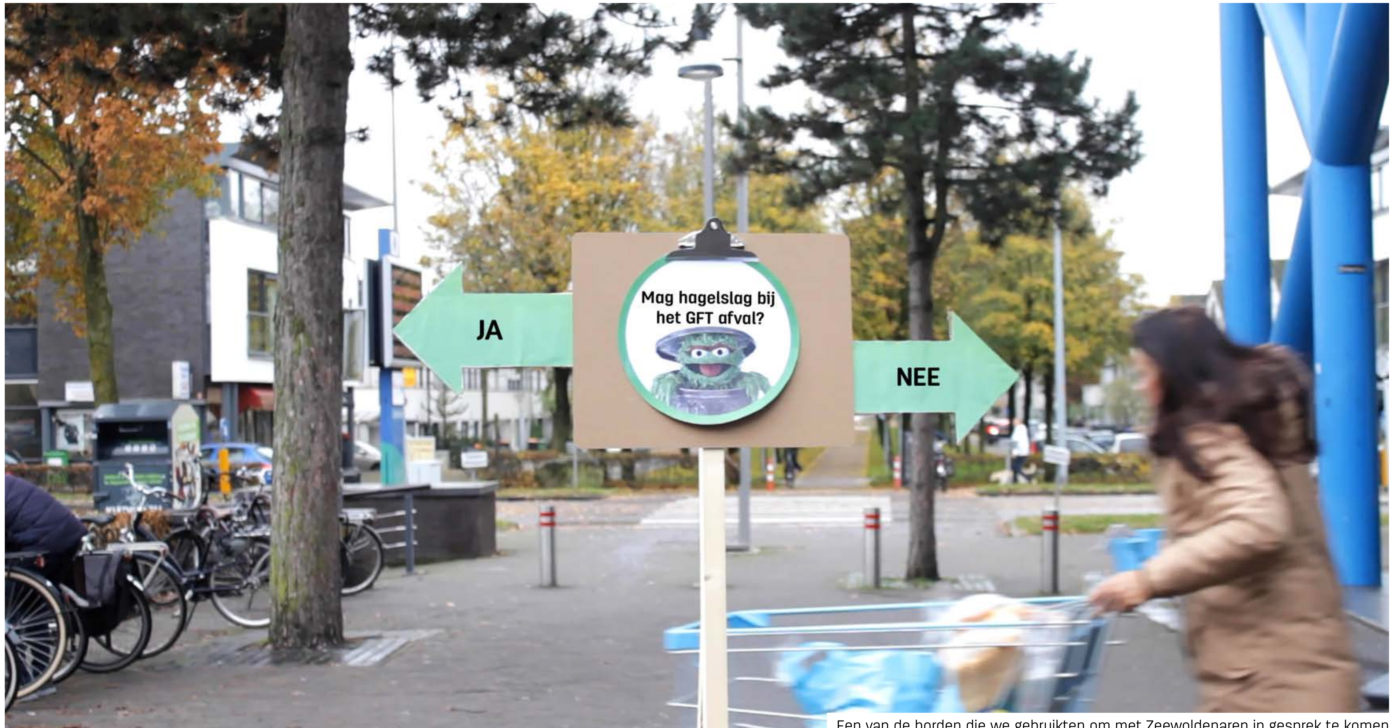
Een van de borden die we gebruiken om met Zeewoldenaren in gesprek te komen