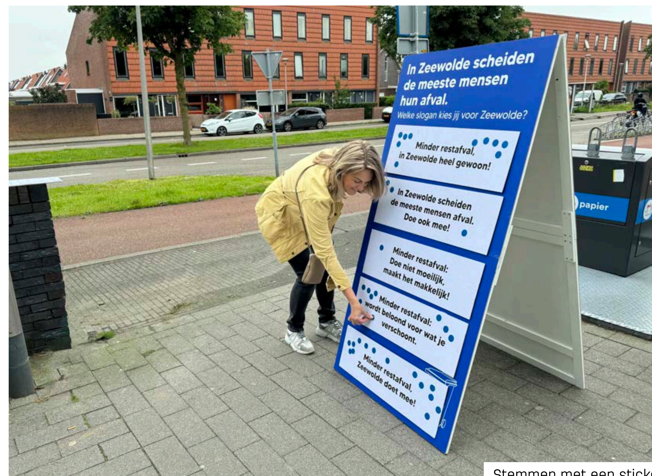
Stemmen met een sticker